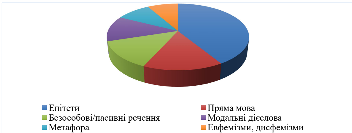
Рис. 2. Частота використання прийомів емоційного впливу

Серед головних прийомів емоційного впливу було виокремлено сім, що найчастіше зустрічаються при аналізі фактичного матеріалу. На рис. 2 відображена частотність їх використання.